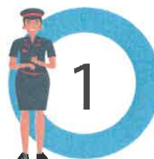
salarié à temps plein (100 %)

C'est à partir du nombre d'ETP que sera constituée la liste des salariés à transférer de la SNCF au nouvel attributaire. ●